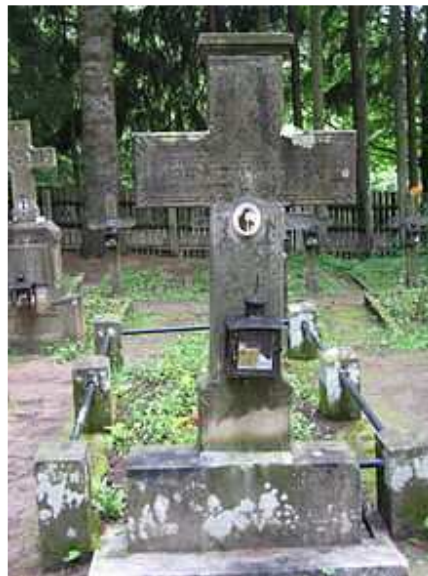
Tombe du staretz

Vénérable Staretz Ioanichie, prie Dieu pour nous!