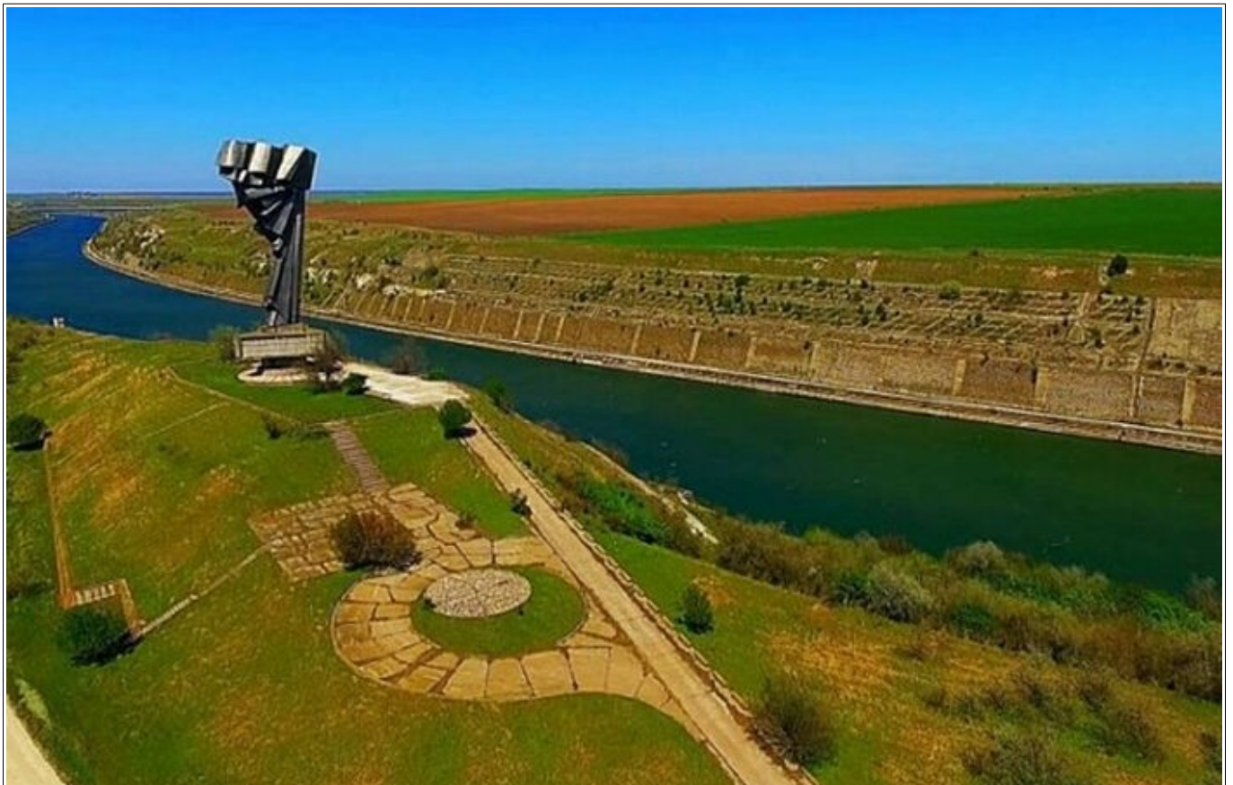
Monument de la jeunesse de 165 pieds au canal Danube-mer Noire, 1980