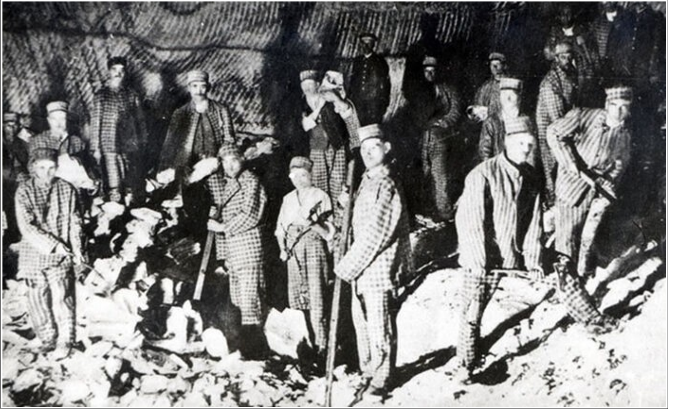
Prisonniers à Târgu Ocna travaillant dans la mine de sel, 1934