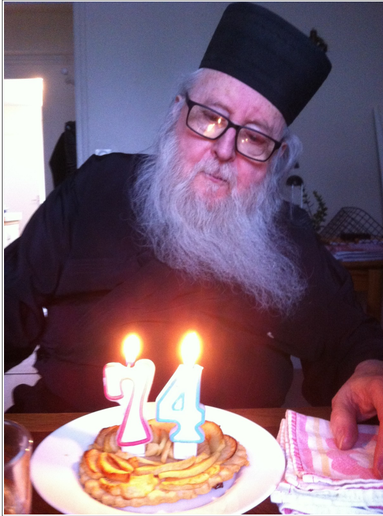
Son dernier anniversaire, Maison Saint Nectaire d'Egine, à Landerneau...

« Mes frères, que sert-il à quelqu'un de dire qu'il a la foi, s'il n'a pas les oeuvres? La foi peut-elle le sauver ? Si un frère ou une soeur sont nus et manquent de la nourriture de chaque jour, et que l'un d'entre vous leur dise: Allez en paix, chauffez-vous et vous rassasiez! et que vous ne leur donniez pas ce qui est nécessaire au corps, à quoi cela sert-il ? Il en est ainsi de la foi: si elle n'a pas les oeuvres, elle est morte en elle-même. Mais quelqu'un dira: Toi, tu as la foi; et moi, j'ai les oeuvres. Montre-moi ta foi sans les oeuvres, et moi, je te montrerai la foi par mes oeuvres. » (Jacques 2, 15-18)